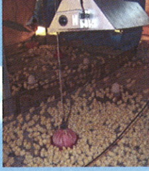
शेतकऱ्याने बनविले पोल्ट्रीसाठी इलेक्ट्रिक ब्रुडर