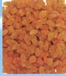
पंढरपूरला साकारला बेदाणा निर्मितीचा 'बीएसआर' ब्रॅण्ड