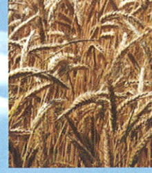
सुधारित पद्धतीने गव्हाची मळणी करण्याच्या टीप्स