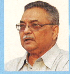
शेतकरी आत्महत्यांशी बीटी तंत्रज्ञानाचा संबंध नाही